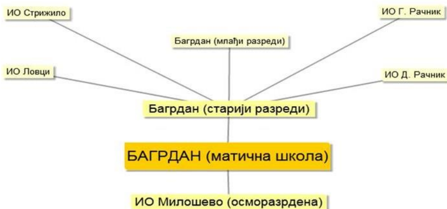
Слика1:Шематски приказ структуре ОШ „Јоца Милосављевић“ у Багрдану